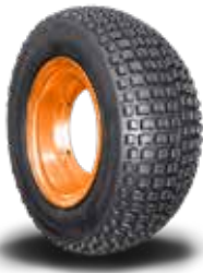
Kart Cross Plus

Medida 17/7.5x8 - Modelo similar ao original do antigo fapinha tipo concha. Consagrado no Kart Cross e campeão em várias pistas. Para ser usado com câmara.