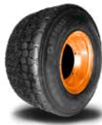
Genius Park 2

Medida 155/50x8 Para mini Buggies e carrinho de parque de diversão. Alta durabilidade e estrutura forte. Para ser usado com câmara.